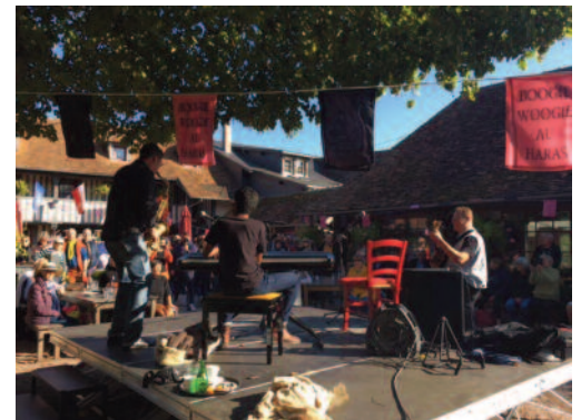
Association Beuvron-Cabourg en Pays d'Auge. Boogie Fête du cidre 2018

Il y aura 100 ans, le 11 novembre 2018, qu'a été signé, dans le « wagon de Rethondes », près de Compiègne, l'armistice de la guerre 1914-1918 mettant fin au conflit avec l'Allemagne. Toutes nos familles ont été touchées par cette guerre qui fut une de plus meurtrières de notre histoire. Elles y ont perdu un ou même plusieurs des leurs dans ces combats.